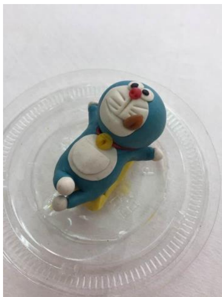
羅仲文·多啦A夢麵塑